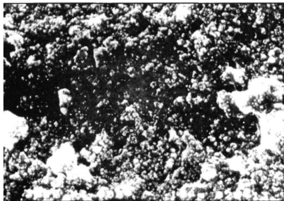
Slika 1. Izgled dentinske površine impregnirane Kavinera-om u jednom sloju, x 1000

pokrovni film koji se stvara nakon aplikacije hrapav evidentno je da nastupa smanjenje pomenutih nepravilnosti povisine formiranih nakon brušenja na šta ukazuju i rezultati SEM (slike 1 i 2).