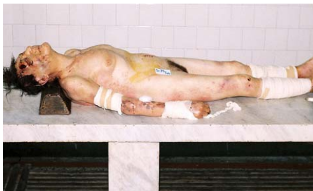
Slika 4. Višestruke povrede glave i tela pok. PM

Mikroskopskim pregledom sadržaja brisom uzetog iz vagine nisu nadjeni spermatozoidi.