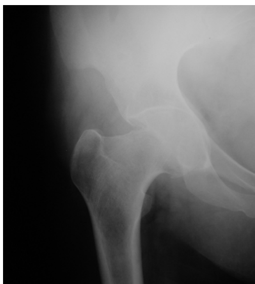
Slika 1. Rentgenski snimak levog zgloba kuka bolesnice stare 57 godina sa reumatoidnim koksitisom