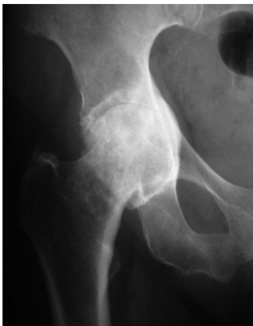
Slika 3. Rentgenski snimak desnog zgloba kuka bolesnice stare 68 godina sa reumatoidnim koksitisom