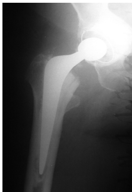
Slika 4. Rentgenski snimak implantirane totalne cementne endoproteze desnog zgloba kuka kod bolesnice sa reumatoidnim koksitisom stare 68 godina

Bolesnica S.M. stara 68 godina, primljena je u Kliniku za ortopediju i traumatologiju KC u Nišu, zbog stalnih bolova i ograničenja pokreta u desnom zglobu kuka. Duže vremena bolovala je od reumatoidnog artritisa. Lečena je medikamentozno i povremenim balneofizikalnim procedurama u više navrata. Na načinjenom rentgenskom snimku desnog zgloba kuka registrovano je uznapredovalo oštećenje zgloba sa izraženom protruzijom acetabuluma (Slika 3). Nakon kompletne preoperativne pripreme, urađena je implantacija totalne cementne endoproteze desnog zgloba kuka. Na kontrolnom rentgenskom snimku položaj komponenti implantirane endoproteze pokazuje zadovoljavajuću poziciju (Slika 4). Nakon operativnog zahvata, bolesnica je aktivirana i upućena na fizikalnu terapiju. Rani postoperativni tok protiče dobro. Bolesnica se dobro oseća. Negira bolove u operisanom kuku i ima zadovoljavajući obim pokreta u operisanom kuku.