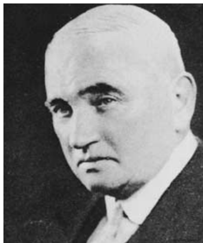
Slika 1. William Ernest Miles

Sir Miles je umro u Londonu 24. septembra 1947. godine. U znak zahvalnosti, Mr. Lawrence Abel, jedan od njegovih kolega, napisao je: "Sve dok karcinom rektuma može biti izlečen jedino hirurški, Miles-ovo ime će se poštovati zbog njegovog pionirskog rada, čvrstih temelja i sjajne nadgradnje gotove hirurške tehnike koju je zaveštao ... " (2).