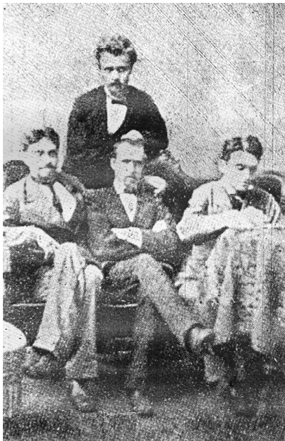
Slika 1 Laza K. Lazarević, sa drugovima, kao student medicine u Berlinu (stoji!)

Odlazi u Berlin 1872. godine, kao državni pitomac, da sluša nastavu kod slavni prof. Helmholca, Di-Boa, Virhova, Hirša, Langebeka, Traubea i Librajha. (Slika 1)